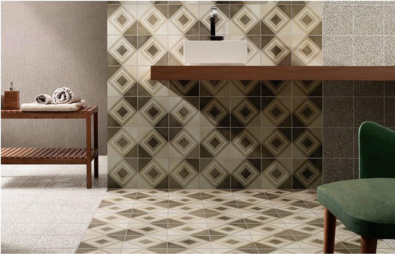
RETRO 4 (OS, GRIS, TAUPE)