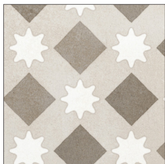
20 x 20 cm (8 x 8) OE.CM.RT5.0808

Tous les items présentés dans ce document font partie du programme d'inventaire Olympia. Pour les commandes spéciales, veuillez contacter votre représentant de Tuiles Olympia.