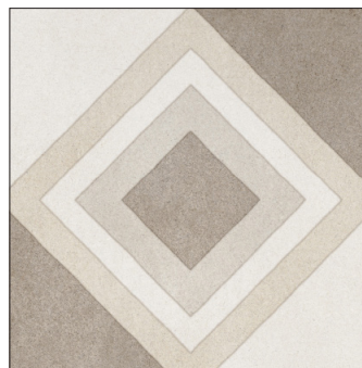
20 x 20 cm (8 x 8) OE.CM.RT4.0808