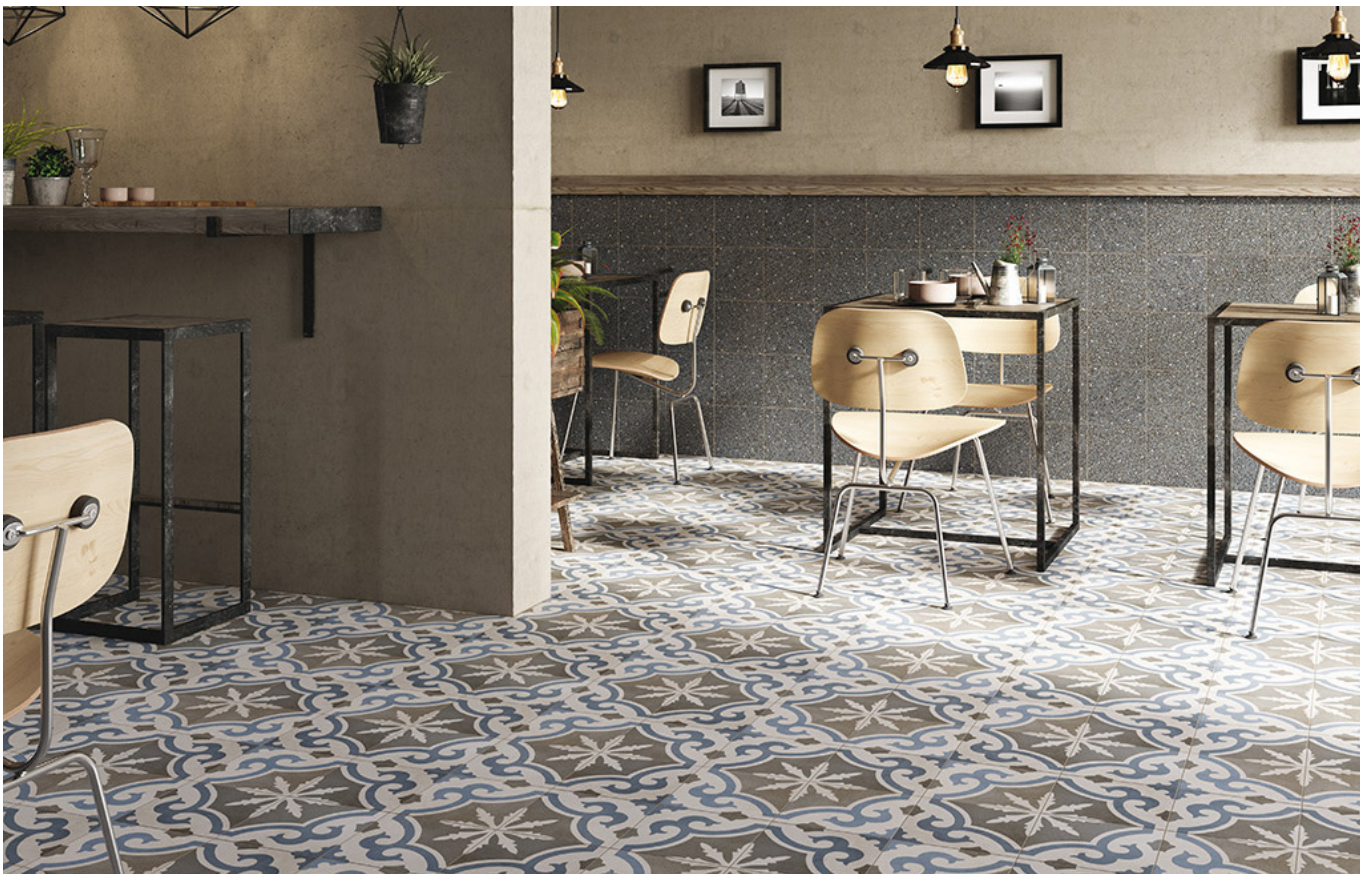
RETRO 2 (BLEU, GRIS)