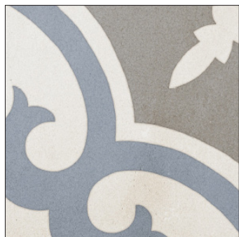
20 x 20 cm (8 x 8) OE.CM.RT2.0808